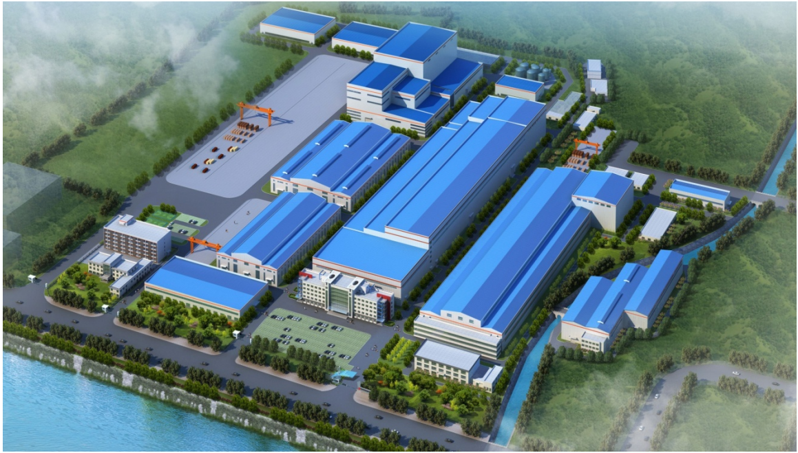
图 1 西电常变厂房规模

西电常变位于素称“八邑名都、吴中要辅”的长三角中心城市——常州市，北枕长江、南濒太湖、西邻南京、东望上海，背靠京沪铁路、沪宁高速和一类开放口岸常州港，拥有直达京沪铁路的自备铁路专用线和连通长江的全国最大 800 吨变压器专用码头，区位和交通条件得天独厚。 西电常变注册资本 82,371.29 万元 ，固定资产总额 76527 万元，占地面积约 320000 m 2 ，建筑面积约 110000 m 2 ，拥有 30000 m 2 特高压生产线、18000 m 2 超高压生产线两条巨型 A 级防尘标准车间、最大起吊能力达到 700t、达到国际先进水平的 20000 m 2 变压器油箱制造车间。现有员工近 1100 人，其中大专以上学历人员占职工总数的 40% 以上，工程技术人员 400 多人，拥有大型和特大型变压器的研发能力与制造装备。满足直流 \pm 1100\text{kV} 换流变压器和交流 1000kV 特高压变压器的生产条件以及 1500MVA/500kV 三相一体变压器的生产能力。自主开发制造的各类变压器产品遍布全国 31 个省、市、自治区，以及新加坡、香港、印度等 20 多个国家、地区。