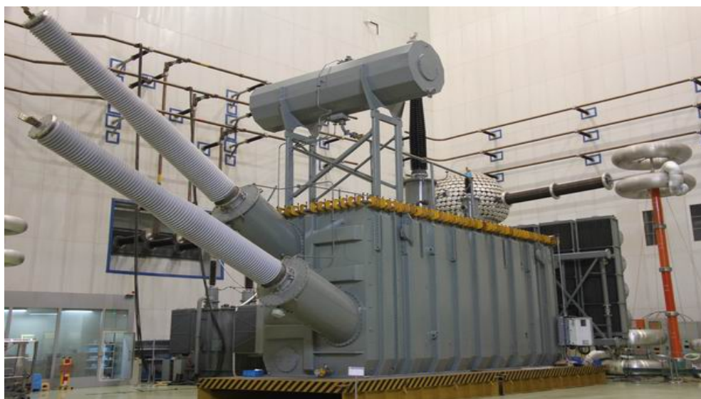
图 2 换流变压器

西电常变自 2006 年 7 月加入西电集团以来，依托集团强大的超（特）高压电力变压器设计、制造技术平台，引进、消化、吸收了超（特）高压变压器的制造技术，企业规模从 8 个亿发展到近 20 亿。截止 2016 年底，已累计产出超百台超特高压产品，其中包括“向家坝-上海” \pm 800\text{kV} 特高压直流输电示范工程 9 台换流变压器、“晋东南-南阳-荆门” 1000\text{kV} 特高压交流输电示范工程 4 台电力变压器、“锦屏-苏南” \pm 800\text{kV} 特高压直流输电工程 14 台换流变压器、“淮南-上海” 1000\text{kV} 特高压交流输电工程 8 台自耦变压器、“糯扎渡-广东”直流输电工程自主化特高压 \pm 800\text{kV} 直流输电工程 4 台换流变压器、“哈密南-郑州” \pm 800 千伏特高压直流输电工程 5 台换流变压器等国际最高电压等级输变电工程项目。国内外顶级产品的成功产出和国家重点项目的顺利完成，标志着西电常变超（特）高压生产线制造产能平稳、技术水准稳固、质量品质卓越。 目前，西电常变是江苏省超特高压变压器工程技术研究中心、国家实验室（CNAS）认证单位、江苏省创新型企业、江苏省输变电装备产业技术创新战略联盟理事长单位，是江苏省内唯一一家具备生产 1000\text{kV} 级变压器产品的企业。 西电常变已快步迈进了我国超（特）高压变压器研制行列，成长为中国西电在我国南方地区建设的巨型变压器生产基地和出海口基地。